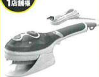
ハンディーアイロン