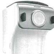
ヌードルメーカー