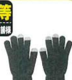
スマートタッチグローブ