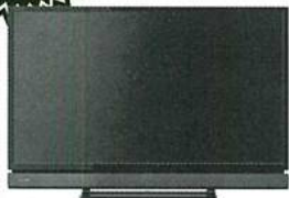
東芝 32インチ液晶テレビ