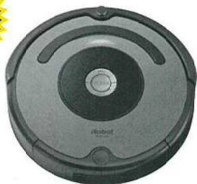
ロボット掃除機 ルンバ641