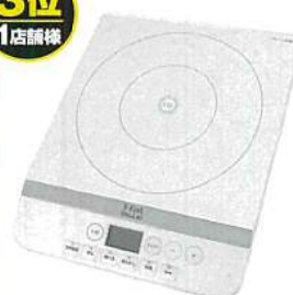
IHクッキングヒーター