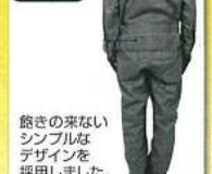
オリジナルつなぎ