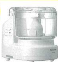
フードプロセッサー