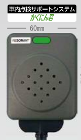
かくにん君 本体 KMK-900