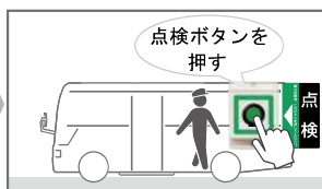
ボタンを押して放送ストップ 点検完了