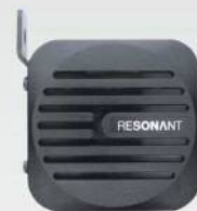
エラーインジケータ 車外スピーカー